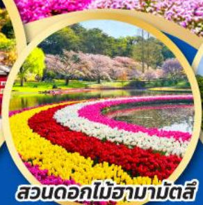
สวนดอกไม้ฮามามิตสึ